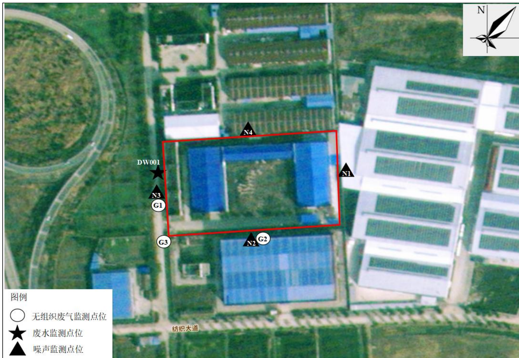
附图4 项目验收监测点位图